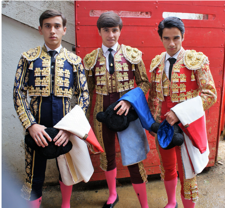
une novillada entre les gouttes mais réussie

la volonté et le travail des organisateurs a été récompensée