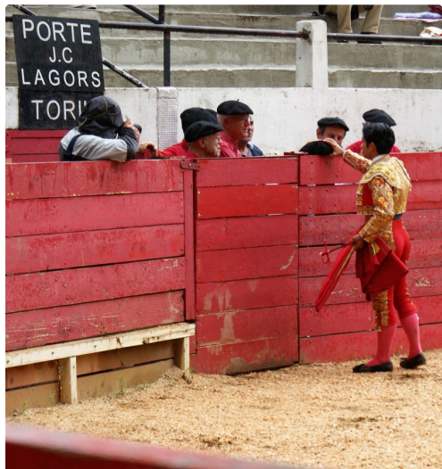
Dédicace du premier Novillo aux " Arénéros"