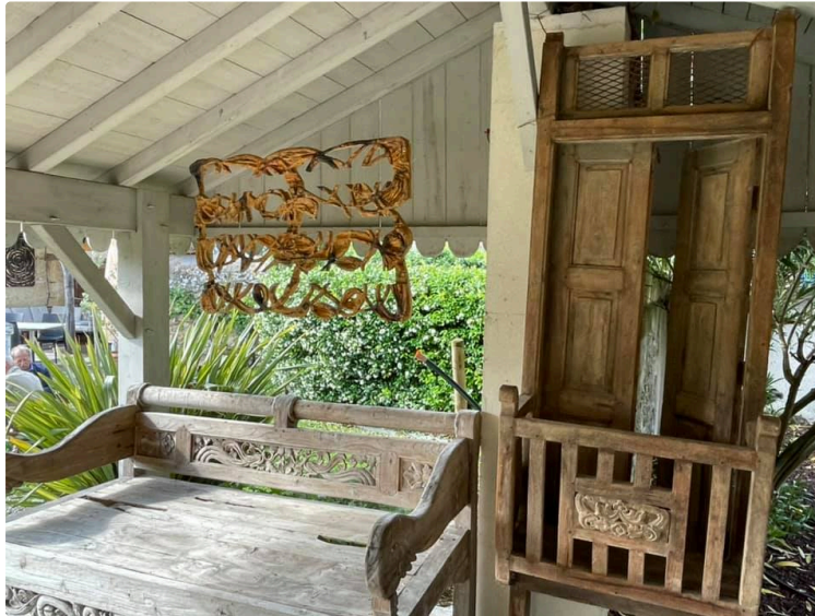
Les animations dans la sous-préfecture