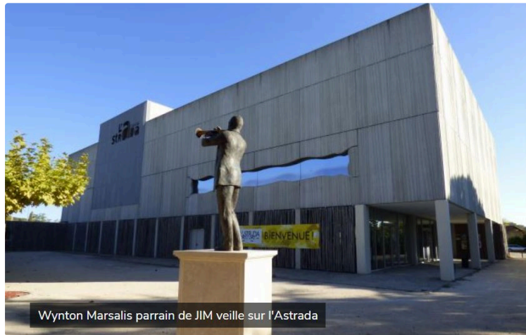
Au coeur de L'Astrada

L'Astrada vous donne rendez-vous durant le festival Jazz in Marciac et au-delà, du 26 juillet au 7 août avec une programmation dédiée qui met à l'honneur le jazz actuel !