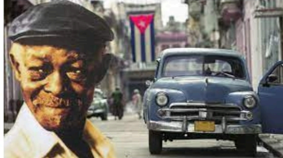
Rappel : pas de musique latine dans les arènes mais au cinéma vendredi soir !

Le week-end prochain aurait dû être celui du festival Tempo Latino 2021.