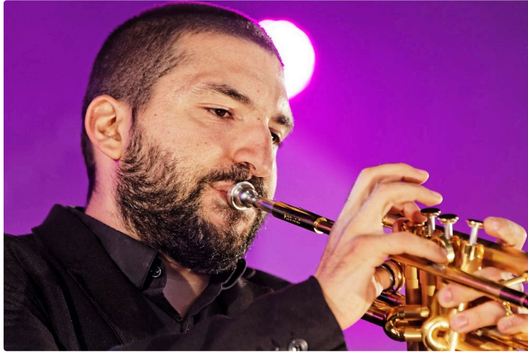
Une soirée prometteuse