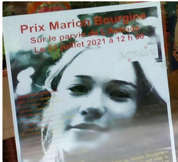
Prix Marion Bourguine