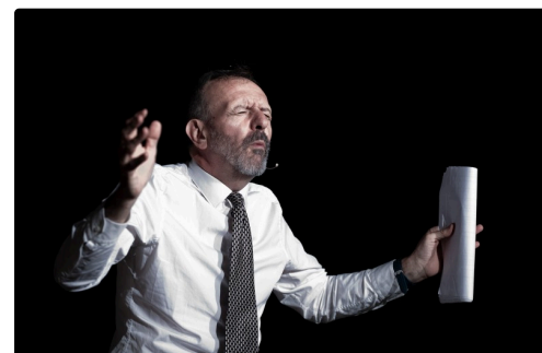
Pénétré de son sujet