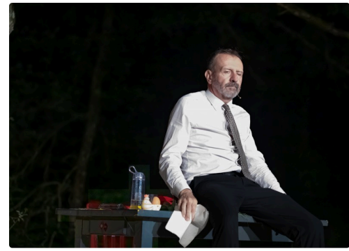
Il couve un œuf