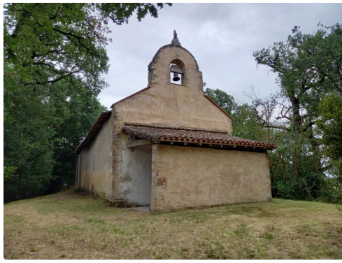
Façade ouest de la chapelle.