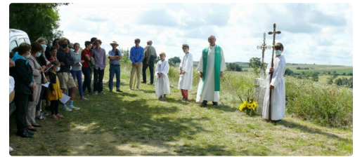
Recueillement de la procession devant la croix de chemin.