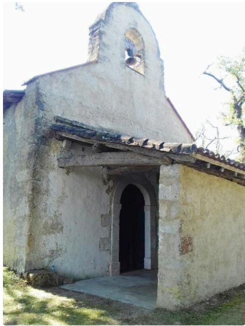
Entrée de la chapelle.