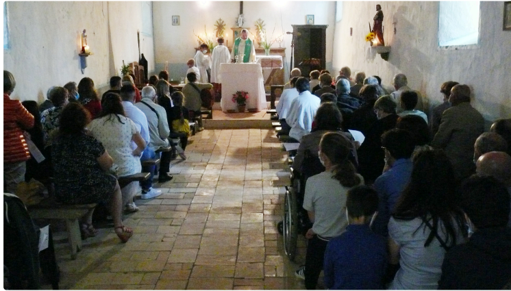
Chapelle de Saint-Martin-Vinagré : la tradition respectée pour la Saint-Barthélemy

Datant de l'époque mérovingienne, la chapelle conserve tout son éclat malgré les nombreuses péripéties qui l'ont secouée