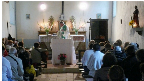
A droite, la statue de Saint-Barthélemy.