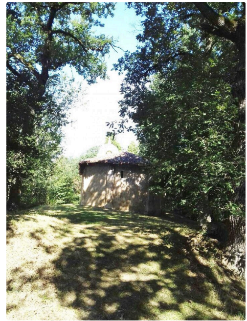
Façade est de la chapelle