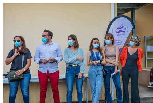
5 Equipe des organisateurs de 4 Saisons 1bis 050821.jpg