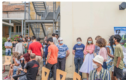
3 Rassemblement jeunes et cadres 1bis 050821.jpg

(1) Association qui a son siège à Perchède et est présidée par Bernard Pierre. Domaines d'intervention : Produits locaux – Innovations – Monde rural – Activités culturelles et traditionnelles – Organisation sociale. Devise : « Mieux vivre au pays dans ce monde qui change ». (2) Groupement d'employeurs basé au Houga, qui fournit du personnel, notamment pour les travaux agricoles et viticoles et qui propose également une aide au recrutement. (3) Établissement scolaire privé avec internat, sous contrat avec le ministère de l'Agriculture dispensant des formations par alternance dans les domaines de l'orientation, de l'agriculture et des services aux personnes. Il accueille des jeunes de la 4ème au bac pro, ainsi que des adultes en formation continue.