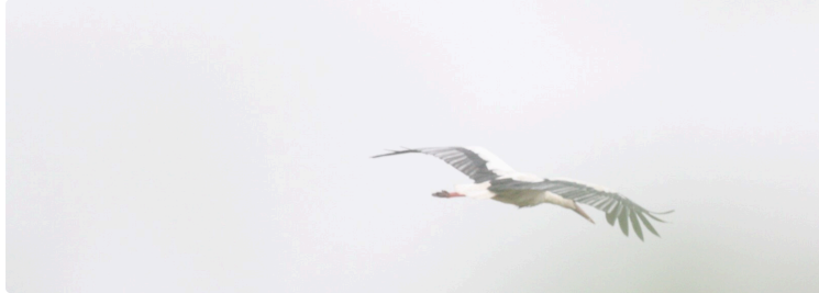
Quand Bezolles séduit Dame cigogne...