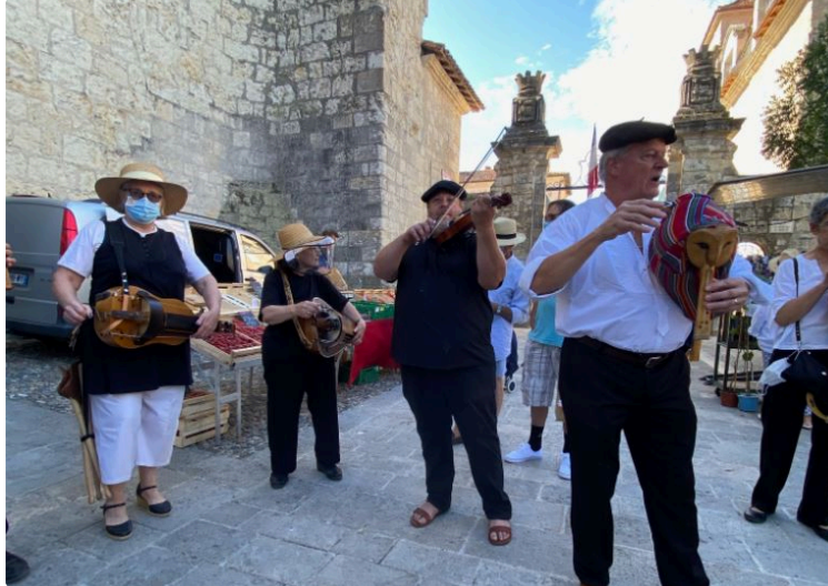
Bain de culture aux Gasconnades de Lecture