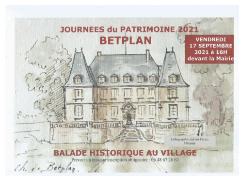
Betplan Journée du Patrimoine 2021.

Pour ceux qui ne le possède pas encore, les conférencières dédicaceront leur livre « Betplan 1419-2019 », Cet ouvrage retrace le résultat de leurs recherches dans près de 200 pages, dans une rédaction claire agrémentée de plans et photos. Cette monographie est un ouvrage qui devrait trouver sa place dans de nombreuses bibliothèques et satisfaire la curiosité des amateurs d'Histoire régionale.