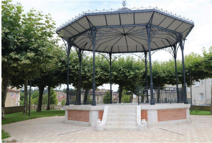
Dépayement et exotisme pour l'inauguration du Kiosque

Découvrez en musique le Rio Paraná, un fleuve impétueux