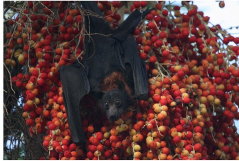
Chauve-souris mon amour

« Bientôt un "renard volant" dans nos vallons ?...Suspendue dans un palmier de "Carpentier" au-dessus d'une forêt de baies, cette "roussette" australienne - Pteropus poliocephalus de son nom latin - reste (pour l'instant) tropicale. (photo prise lors d'un séjour en Australie) »