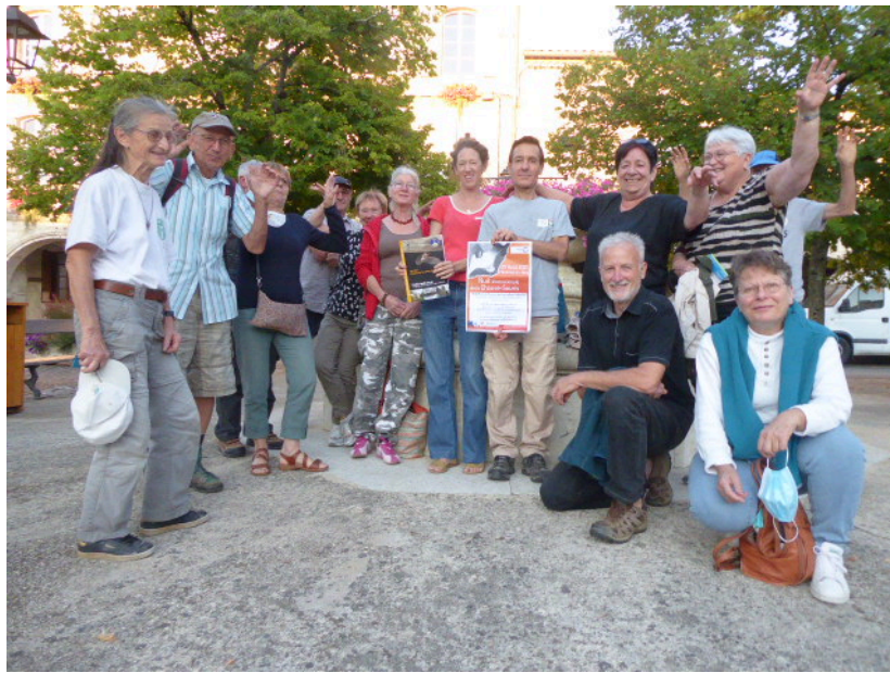
Le fan-club de cette 25 ème nuit internationale de la chauve-souris