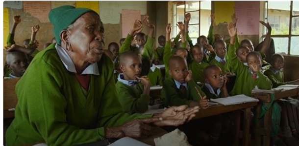
Les sorties nationales de cette semaine au Gascogne

Avec un documentaire sur la plus vieille écolière au monde