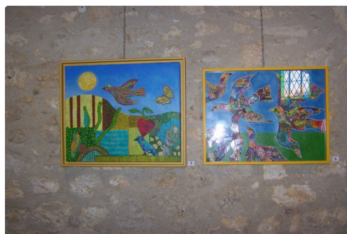
cecile de bruijn et maia alonso à sarrant 003.JPG