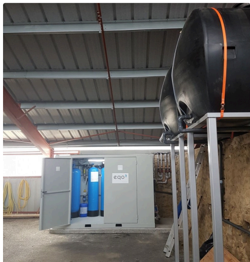
EQO 2 Céréalière.jpg