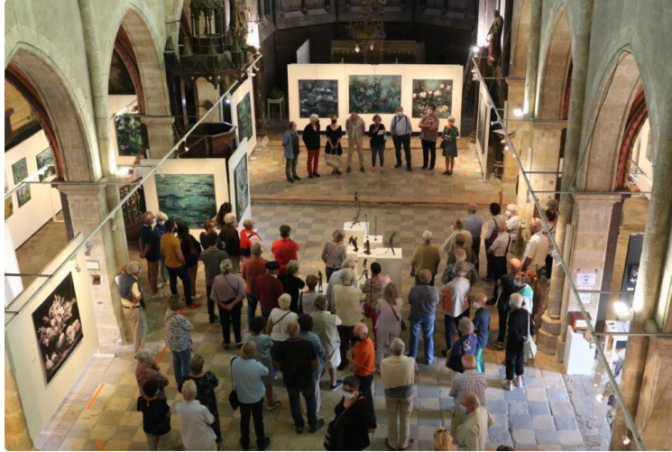
Un mois de découverte : trois artistes inédits à l'Espace Saint-Michel