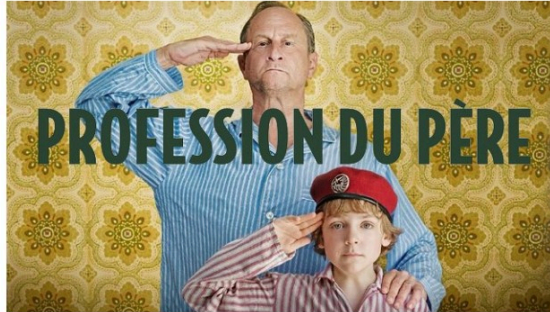
"Profession du père" au cinéma mardi soir

Mardi soir à 21 h , Cine Qua Non diffuse Profession du père , un drame de Jean-Pierre Améris avec Benoît Poelvoorde (1 h 45 )