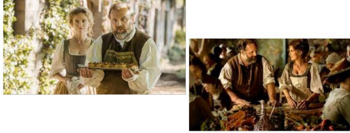
Le film "Délucieux", l'histoire du premier restaurant, en sortie nationale

En sortie nationale, Cine Qua Non vous propose jeudi à 21 h le film Délucieux de Eric Besnard avec Grégory Gadebois, Isabelle Carré et Benjamin Lavernhe