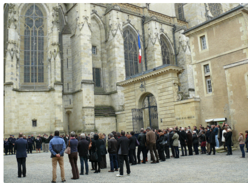
Une centaine de personnes ont assisté à la minute de silence.