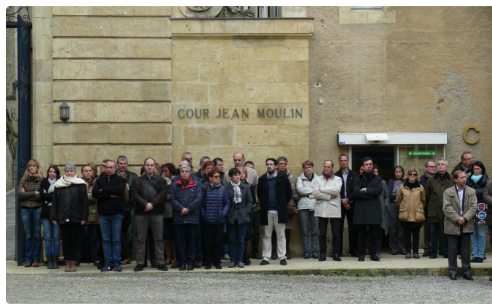
Les divers représentants des services de l'