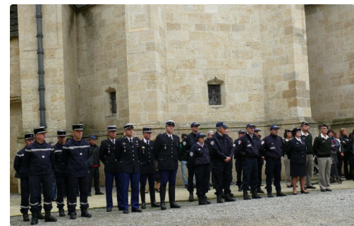
Les représentants du SDIS Gers, de la police nationale, de l'