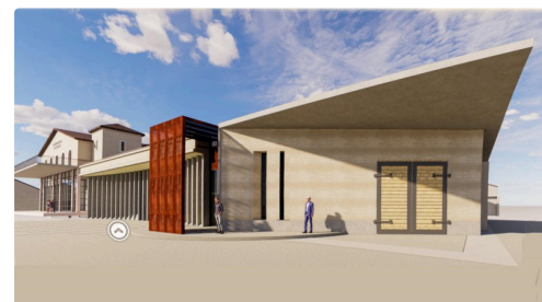
Le chai du côté réception de la vendange