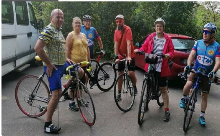
Tout en douceur, chacun son rythme