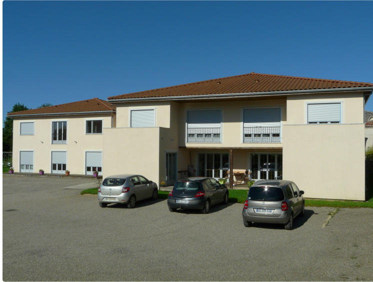
Bien vieillir à La Romieu

Toute l'équipe vous attend pour ces deux journées Portes Ouvertes !