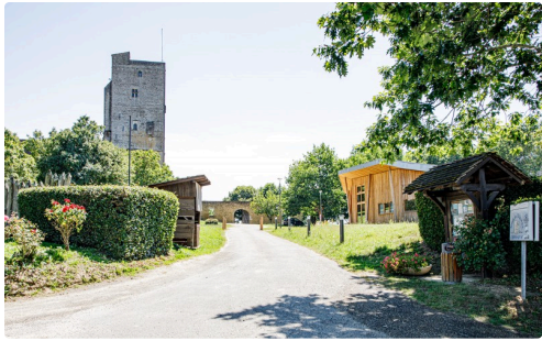
1 Entrée du site de la Tour de Termes 240620.jpg