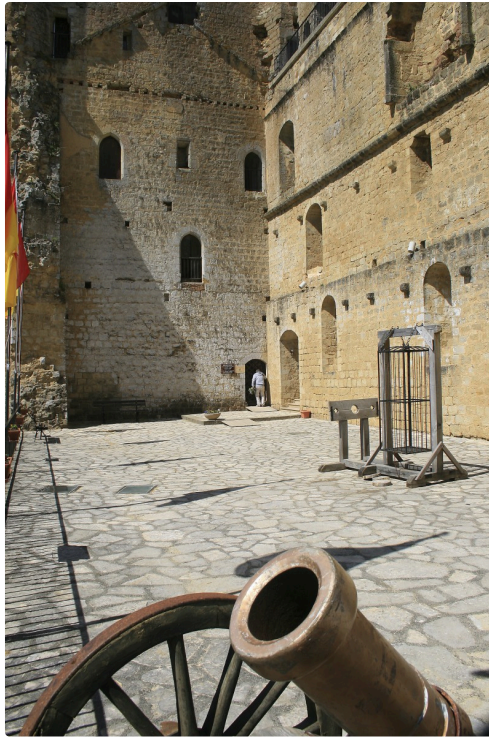
L'esplanade 1 bis avril 08.jpg