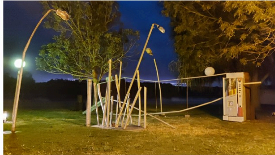
Un spectacle à ne rater sous aucun prétexte, "Allant vers" de la compagnie Kiroul !

Si vous ne devez voir qu'un spectacle du festival N'amasse pas mousse - sans préjuger en rien de la qualité des autres spectacles proposés-, c'est la dernière création de la compagnie Kiroul, Allant vers qui termine à Castéra Verduzan, sur ses terres, une tournée estivale.