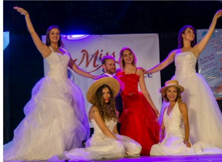
Election de Miss Elegance Gers Bigorre à Vic-Fezensac samedi 16 octobre !

Pour la 2eme année consecutive, Vic-Fezensac va accueillir l'élection de Miss Elegance Gers Bigorre 2021 qualificative pour Miss Elegance Midi-Pyrénées 2021 samedi 16 octobre à 21 h salle polyvalente.