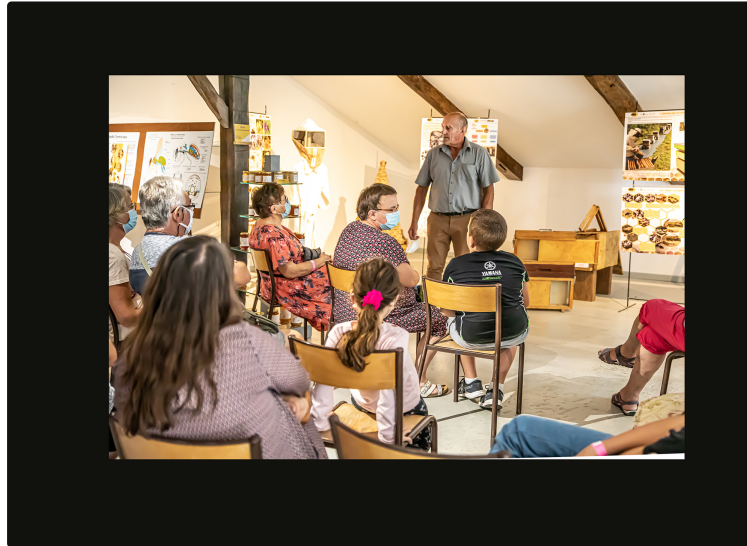
Récolte de miel et dégustation à Toujouse ce 19 septembre

Le Musée du Paysan gascon propose au public, à l'occasion des Journées européennes du patrimoine, un atelier de récolte et de dégustation de miel à 15 heures dimanche 19 septembre.