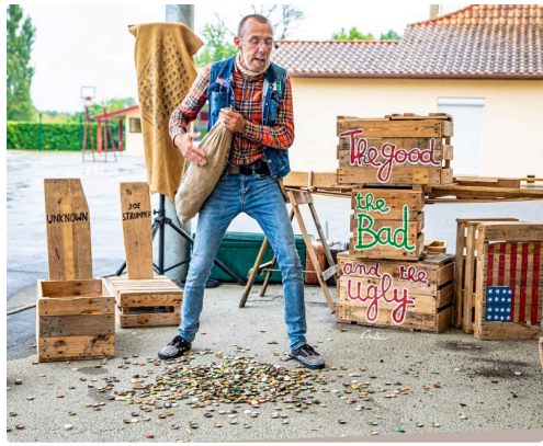
Le bon trouve le trésor dans la tombe unknown