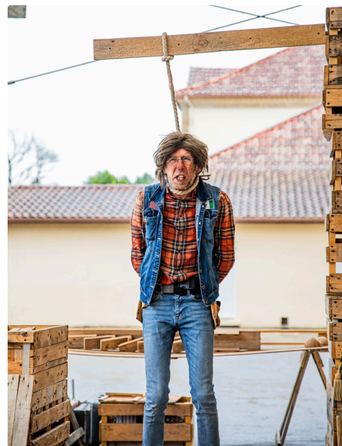
Pendaison du truand