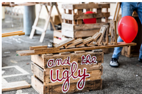
L'arrivée de la boule fait éclater le ballon