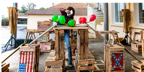
1 Bataille pour un pont entre Confédérés et Yankees