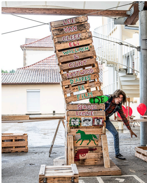
Présentation : le ballon vert va exploser...