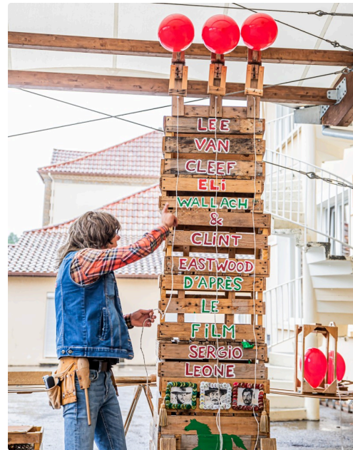
6 ...et tout se met en place (on distingue le reste du ballon)