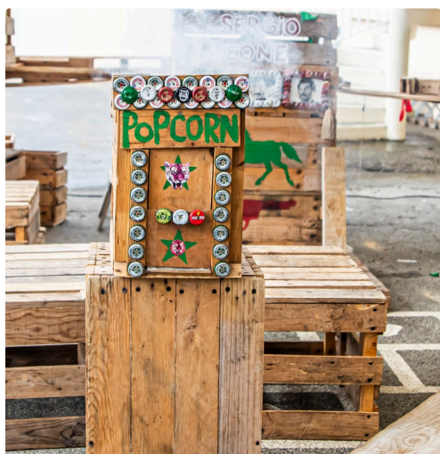
Machine à pop-corn avec explosif