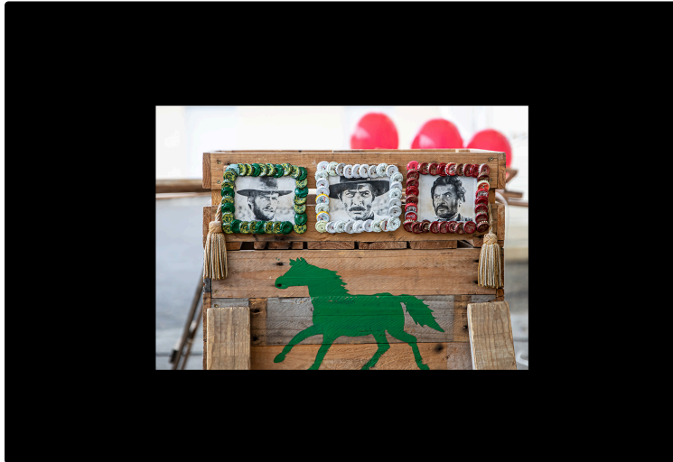
Spectacle cocasse, loufoque, original et excellent au Houga

30 ballons, 20 caisses et des pistolets à agrafes pour une parodie de western spaghetti