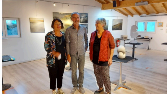
Une exposition d'exception à La Varangue

Lieu multi-culturel vicois, la Varangue met souvent à l'honneur des artistes lors d'expositions dans ses locaux.