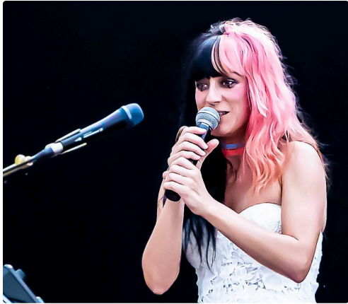
8 Frederika 1bis 230921.jpg