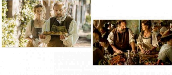
"Délicieux", l'histoire du premier restaurant au cinéma samedi soir

Si vous ne l'avez pas vu lors de sa sortie nationale, Cine Qua Non vous propose samedi à 21 h le film Délicieux de Eric Besnard avec Grégory Gadebois, Isabelle Carré et Benjamin Lavernhe