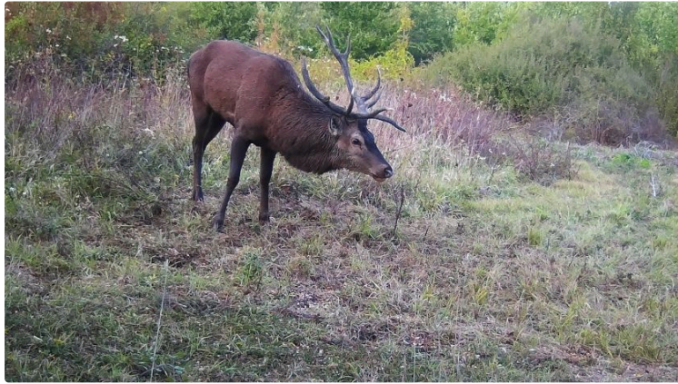
Une exclusivité lors de l'AG de la société de chasse Condom-Béraut

Une vidéo pour découvrir des animaux dans leur environnement naturel