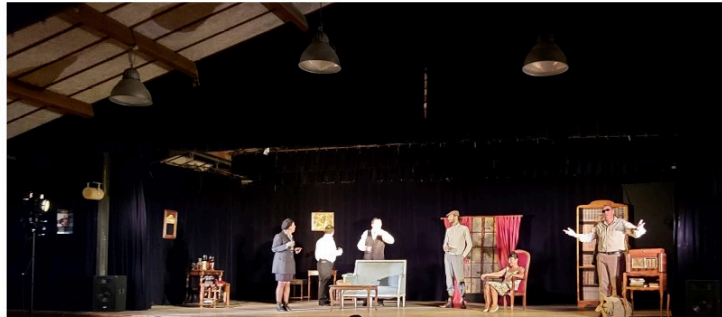
"Le repas des fauves", une soirée qui ne manquait pas de mordant!

L'association In § Off ouvrait sa saison vicoise salle polyvalente samedi soir avec une pièce de Vahé Katcha Le repas des fauves interprété par 8 acteurs de la troupe "Les pieds dans le plat" de Tarbes.