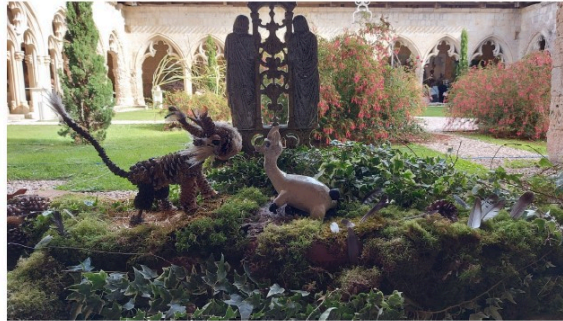
Eclosions magiques dans le cloître de La Romieu samedi !