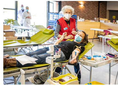
Don du sang à Nogaro en mars 2021