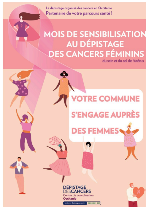
Affiche du Centre régional de coordination de dépistage des cancers en Occitanie