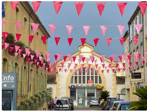
La place de la mairie pavoisée pour Octobre rose