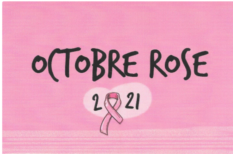
Gym Plaisir et Lous Quarantapes unissent leurs efforts.

Nous nous retrouverons le dimanche 17 octobre pour une randonnée au profit d'Octobre Rose.