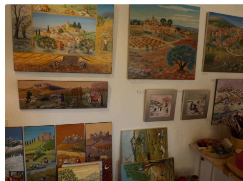
Des couleurs et du noir et blanc, du figuratif et de l'imaginaire