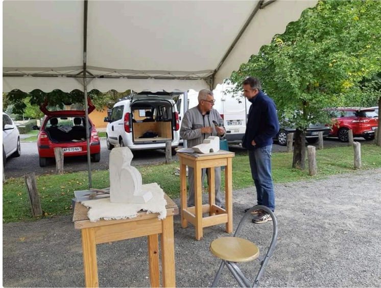
Salon d'art et symposium de la sculpture