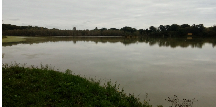
Photo- titre : L'ancien déversoir du XIX éme au pied d'une "ripisylve"( boisement des berges)