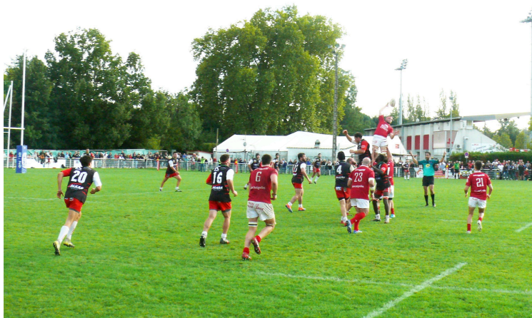
Le RCA s'impose, reste leader, mais n'a pas convaincu

Les Auscitains assurent l'essentiel lors d'une rencontre décousue face à de coriace basques