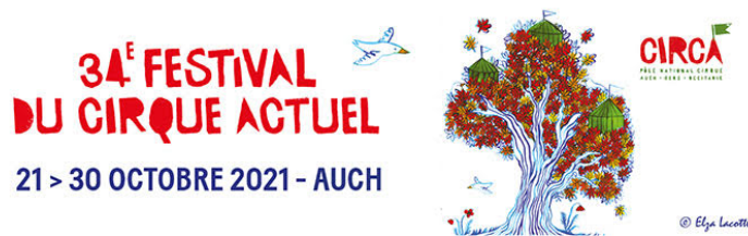
Festival CIRCa : J - 10

Trois chapiteaux ont déjà poussé au CIRC, une compagnie est arrivée pour une résidence de reprise, il y a de l'effervescence à la billetterie, à l'accueil des artistes, des écoles de cirque, des programmateurs, à la coordination des bénévoles, au service communication, à la technique... bref, partout !