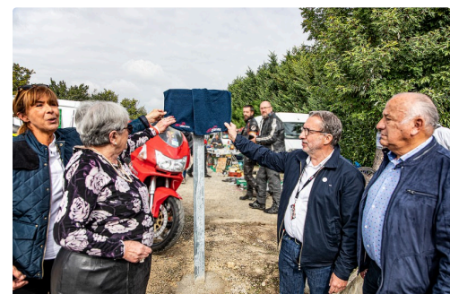
Dévoilement de la plaque de l'avenue André Diviès