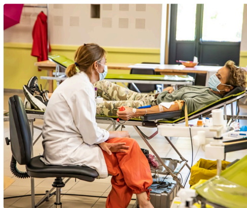
Donneuse de sang