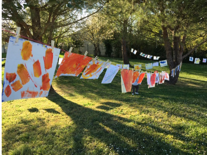
La Grande Lessive revient

Elle s'exposera jeudi 14 octobre devant la mairie de Marciac.