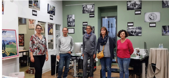
"Un métier passion, assistante maternelle", une très belle exposition photographique à voir à l'Office de Tourisme

Mardi dernier, avait lieu à dans les locaux de l'Office de Tourisme d'Artagnan en Fezensac, le vernissage de l'exposition photographique « Un métier passion, assistante maternelle » réalisée à l'occasion des 20 ans du Relais d'assistantes maternelles « Cabriole » devenu récemment le Relais Petite Enfance.