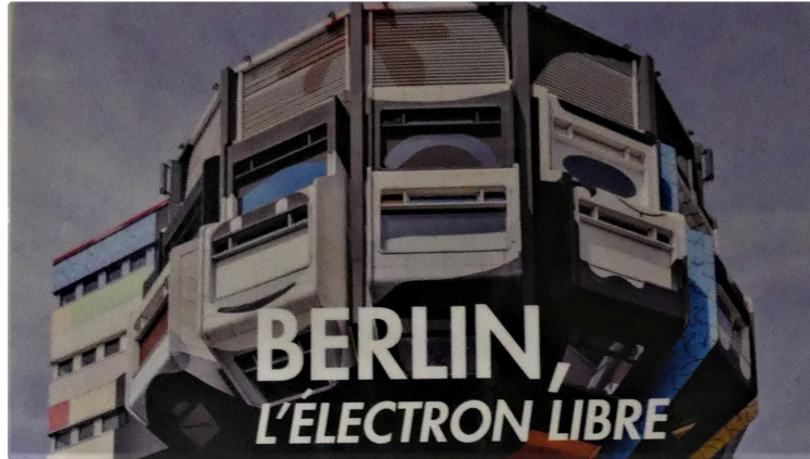
Maison de la région : Exposition « BERLIN, L'ELECTRON LIBRE.

A l'occasion de la 3ème édition de la Quinzaine Franco-Allemande en Occitanie, la Maison de la Région d'Auch et Sandrine Redolfi De Zan sa directrice accueille l'exposition « Berlin, l'électron libre ». Cette exposition a été créée en 2017 par l'Ambassade d'Allemagne en France, avec des photos de Prisca Martaguet et des textes de Marianne Floch.