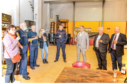
Le pot final