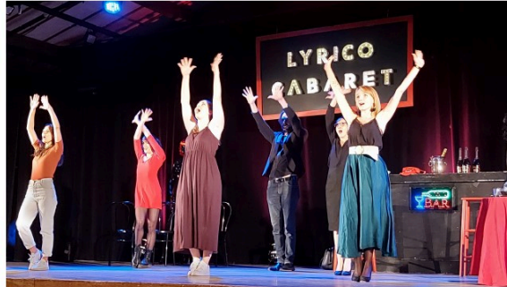
Lyrice Cabaret : fantaisie et virtuosité avec Chants de Garonne dimanche !

Quel bonheur de renouer avec les spectacles vivants !