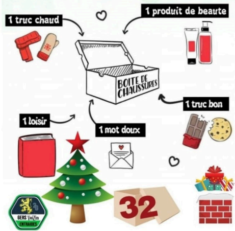
Noel et soloidarité 2021 (2).jpg